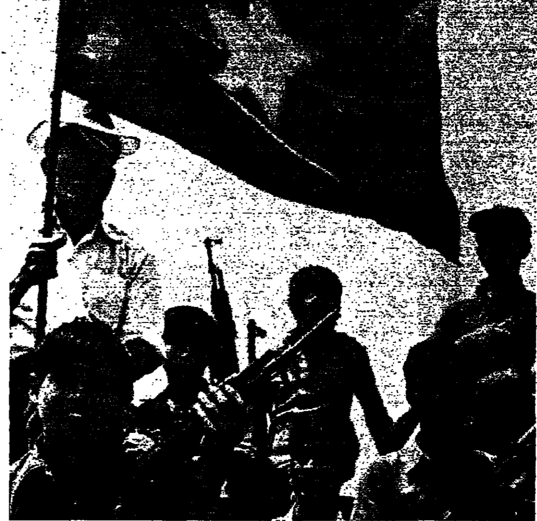
توار من «الفيكونغ» يرفعون علمهم

وقال جان لوي ارنو مراسل وكالة الصحافة الفرنسية « ان الرئيس الفيتنامي الجنوبي بومبيو انصرف بعد اصدار أوامره بوقف إطلاق النار من جانب واحد، ويحيطه بعضي معاونيه، وعدد من وزراء الحكومة المستقيلة.